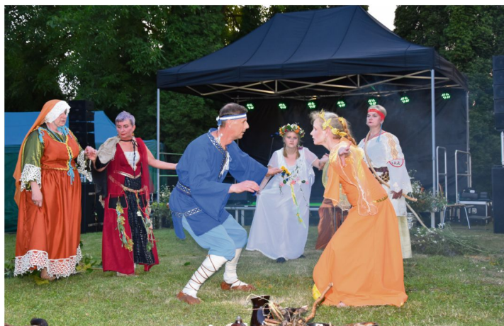
Fot. Justyna Grabowska-Malysa