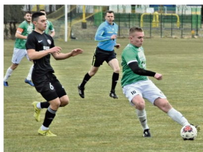
LKS Rajsko otworzy sezon 2022/23 sparingowym meczem z Jawiszowicami. To spotkanie odbędzie się 23 lipca.

W dwóch ostatnich edycjach to właśnie ekipa z Rajska sięgała po Puchar Polski na szczeblu oświęcimskiego podokręgu. W poprzednim sezonie w wielkim finale wygrała po serii rzutów karnych 4:3 z klasę wyżej notowanymi Jawiszowicami. W regulaminowym czasie był bowiem remis 2:2. Przypoda z Pucharze Polski zakończyła się dopiero na 1/8 szczeblu Małopolski w Nowym Brzesku, gdzie miejscowa Nadwiślanka pokonała zespół Krzysztofa Zarzyckiego 3:1.