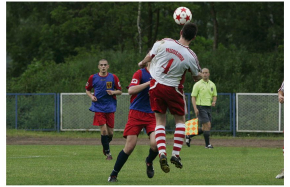
Pierwszą rundę rozgrywek Pucharu Polski w oświęcimskim podokręgu zaplanowano na 23 i 24 lipca.

Pary pierwszej rundy Pucharu Polski (23-24 lipca): LKS Bobrek – Strumień Polanka Wielka, Oldboys Jawiszowice – Orzel Witkowiec, Oldboys Przecliszyn – Niwa Nowa Wieś, Skawa Podolsze – Korona Harmęż, Soła Łęka – Górniki Brzeszcze, Wichura Głęb-